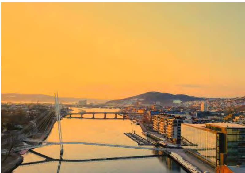
Drammen Rivercup Arena