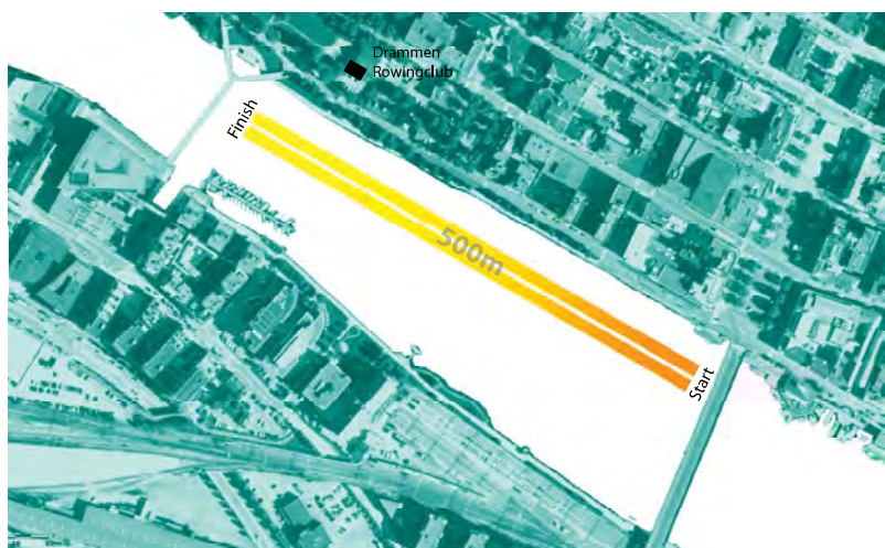
Regattabane sprint ca. 500m

Vinnerne i hver klasse blir behørig titulert. Vinnere av klassene Dame og Herre singlesculler får de høyt-hengende titlene "Queen of the river" og "King of the river".