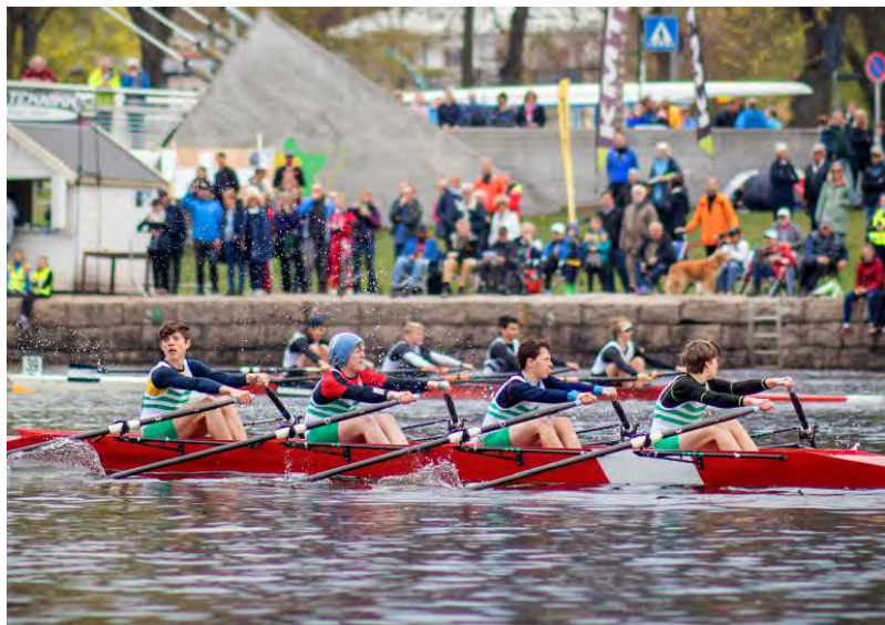
HJB 4x, sprintduell 2019