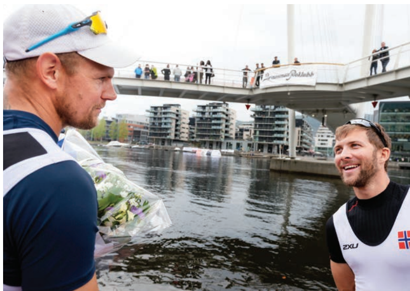
Superduell 2019, Olaf Tufte vs. Kristoffer Brun