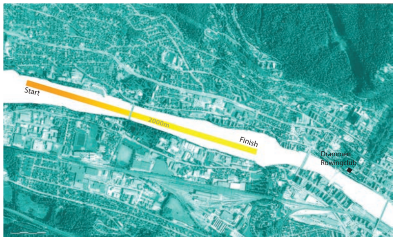
Regattabane kvalifisering ca. 2000m

De raskeste båtene i hver klasse kvalifiseres til sprintduellene.