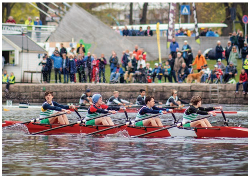
HJB 4x, sprintduell 2019