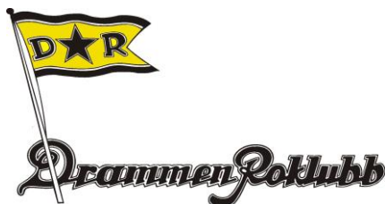
Drammen Roklubbs konkurransedrakt