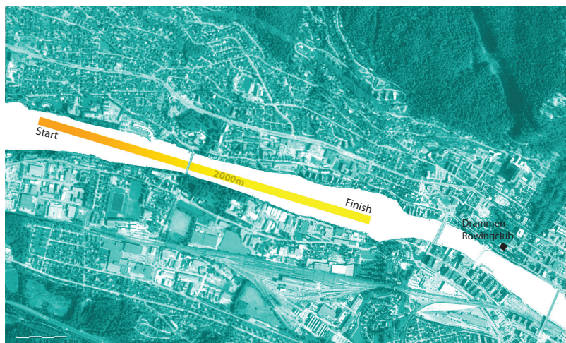
Regattabane kvalifisering ca. 2000m

De raskeste båtene i hver klasse kvalifiseres til sprintduellene.